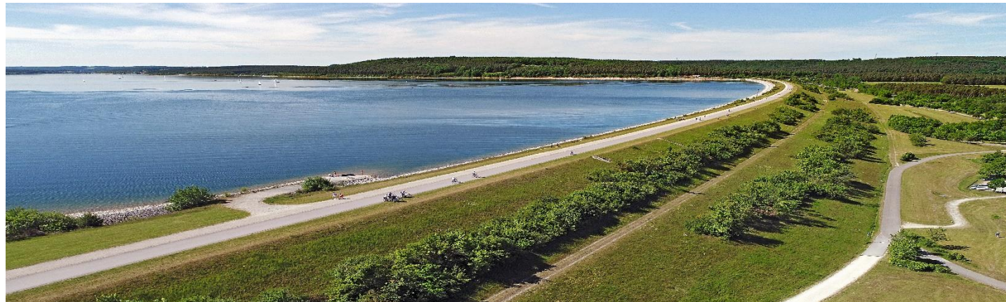
Brombachsee: größter staatl. Speichersee in Bayern