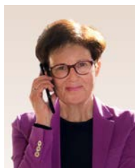
Gudrun Brendel-Fischer už integraciją atsakinga pareigūnė Bavarijos vyriausybėje