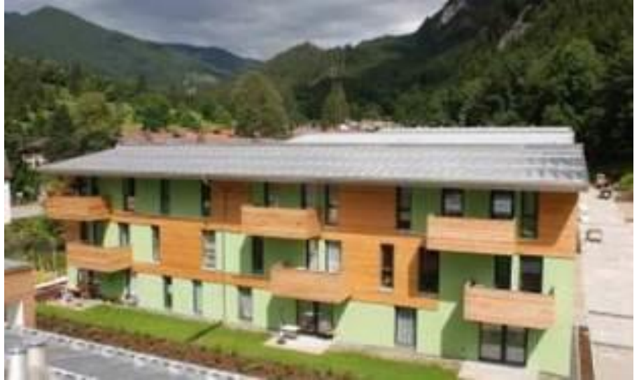
Erster Bauabschnitt, Blick auf die Westfassade