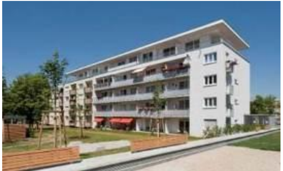
Neuer Anbau Wohngebäude